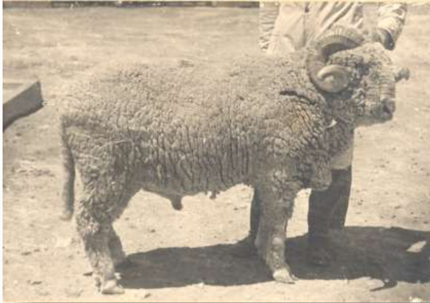
Κριός Merinos.