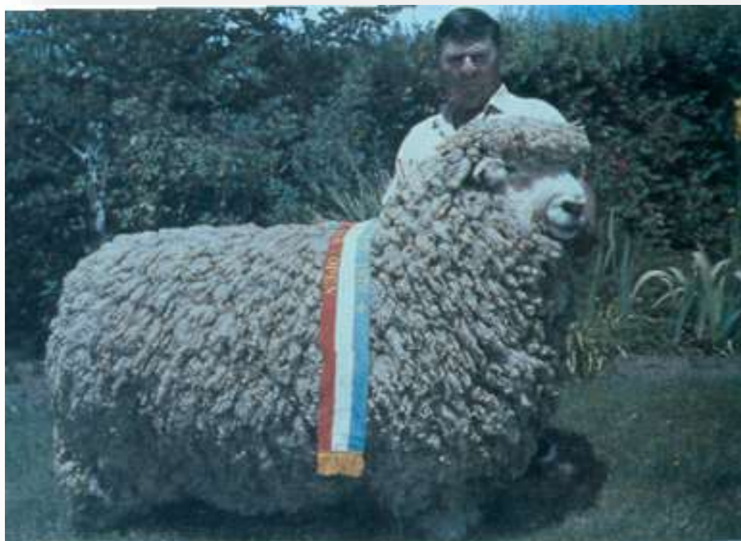
Champion Romney New Zealand Ram.

Κριός Romney (πηγή: αρχείο Εργαστηρίου Γενικής και Ειδικής Ζωοτεχνίας).