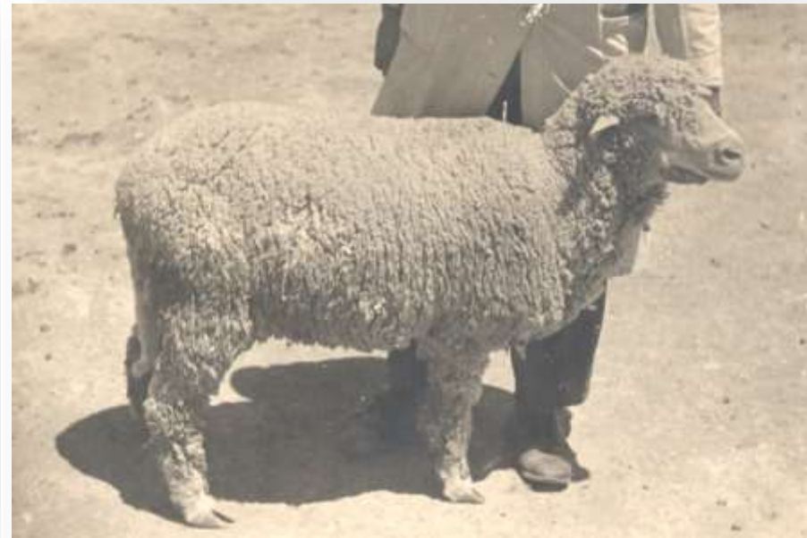
Προβατίνα Merinos.