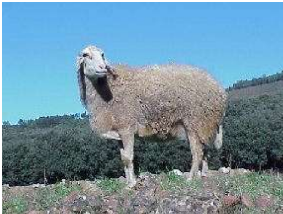
Γαλακτοπαραγωγό πρόβατο Assaf ( http://www.sheep101.info/Images/Breeds/Assaf2.jpg ).