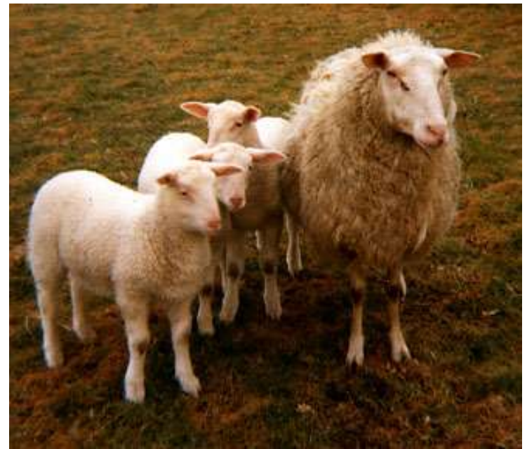
Γερμανικό γαλακτοπαραγωγό πρόβατο ( http://www.ansi.okstate.edu/breeds/sheep/friesianmilk/fries1.jpg ).