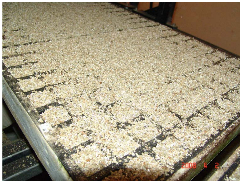
ΚΑΛΥΨΗ ΚΥΒΩΝ ΜΕ ΒΕΡΜΙΚΟΥΛΙΤΗ