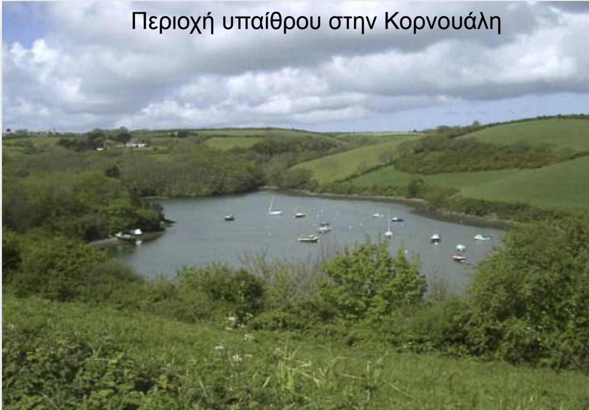
Περιοχή υπαίθρου στην Κορνουάλη

Η μελέτη της αναστροφής της αστικοποίησης στην Κορνουάλη, που βρίσκεται μακριά από μητροπολιτικές περιοχές, περιέγραψε έξι κατηγορίες «νεοφερμένων»: