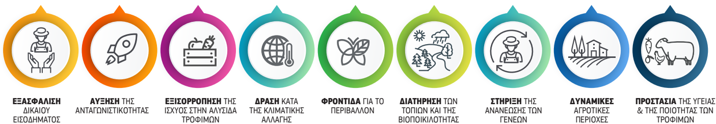
ΕΞΑΣΦΑΛΙΣΗ ΔΙΚΑΙΟΥ ΕΙΣΟΔΗΜΑΤΟΣ