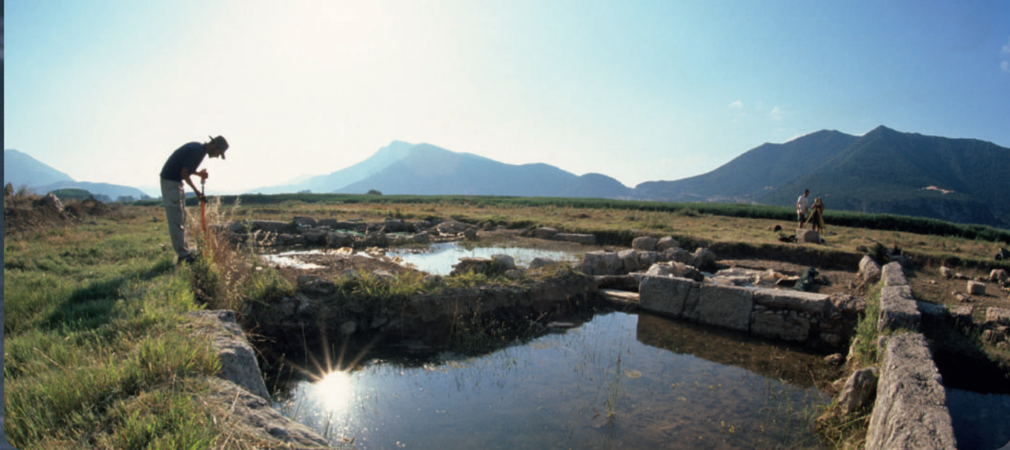
Αρχαιολογική έρευνα στη λίμνη Συμφαλία.

Η έννοια των οικοσυστημικών υπηρεσιών φαίνεται να είναι μία δυναμικά ισχυρή ιδέα για την καθοδήγηση της ολοκληρωμένης ανάπτυξης, καθώς και της ανάπτυξης δίκαιων στρατηγικών και πολιτικών αποφάσεων για την πρόσβαση στους φυσικούς πόρους και τη διαχείρισή τους.