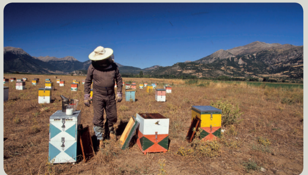
Μελισσοκόμος κοντά στη λίμνη Στυμφαλία.

Η καλή κατάσταση των οικοσυστημάτων σχετίζεται άμεσα με την ικανότητά τους να παρέχουν αντίστοιχα οικοσυστημικές υπηρεσίες.