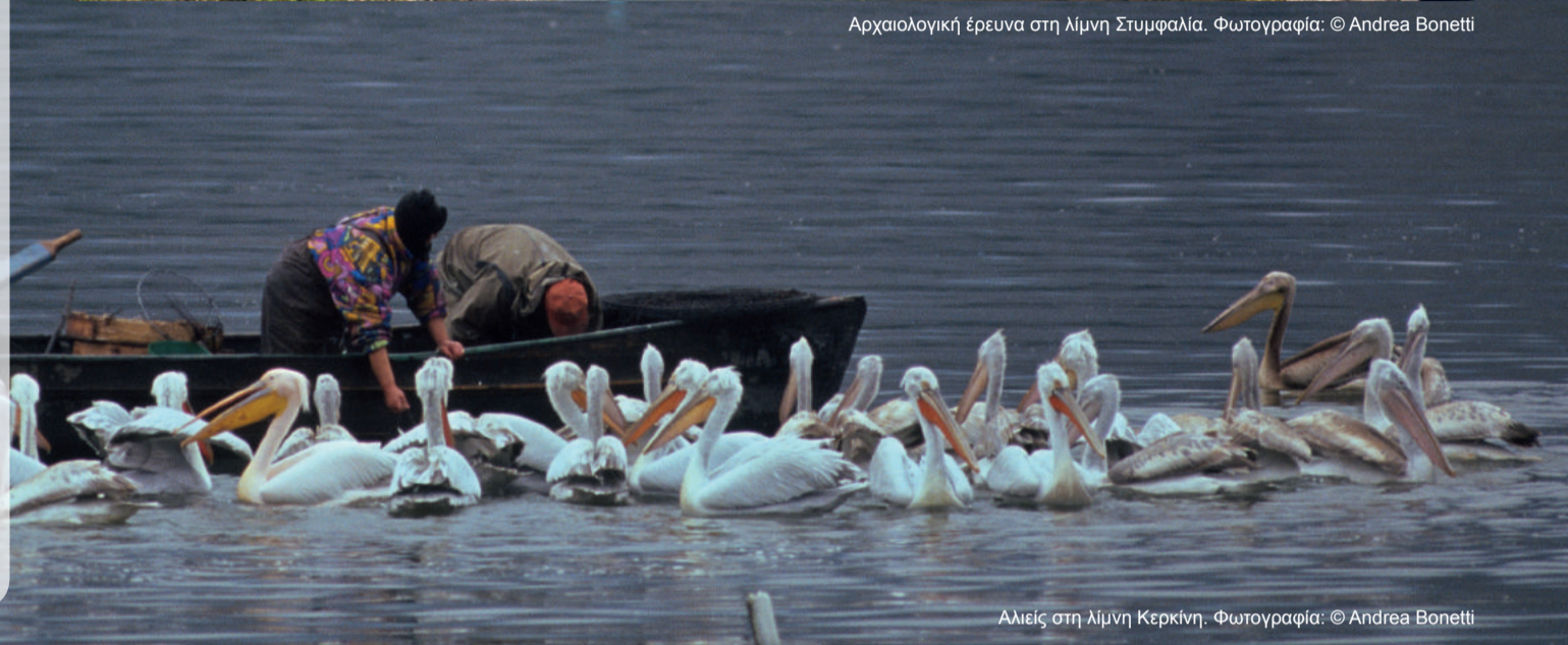
Αλιείς στη λίμνη Κερκίνη.