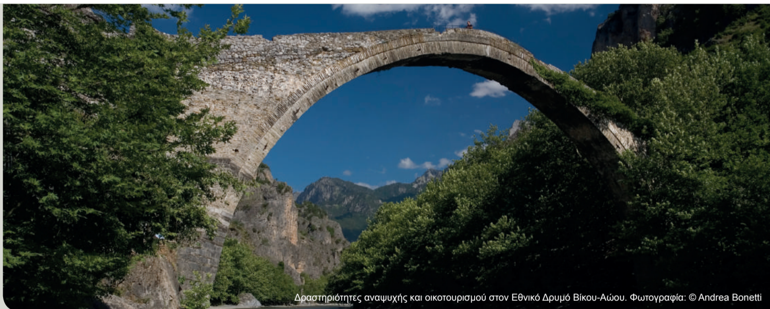
Δραστηριότητες αναψυχής και οικοτουρισμού στον Εθνικό Δρυμό Βίκου-Αίωου.

Συνεπώς, στόχος των οικοσυστημικών υπηρεσιών είναι η ανάδειξη της αξίας των οικοσυστημάτων, οικονομικής ή όχι, δηλαδή της αποτίμησής τους μέσω της χρήσης μιας μονάδας μέτρησης και παρακολούθησης.