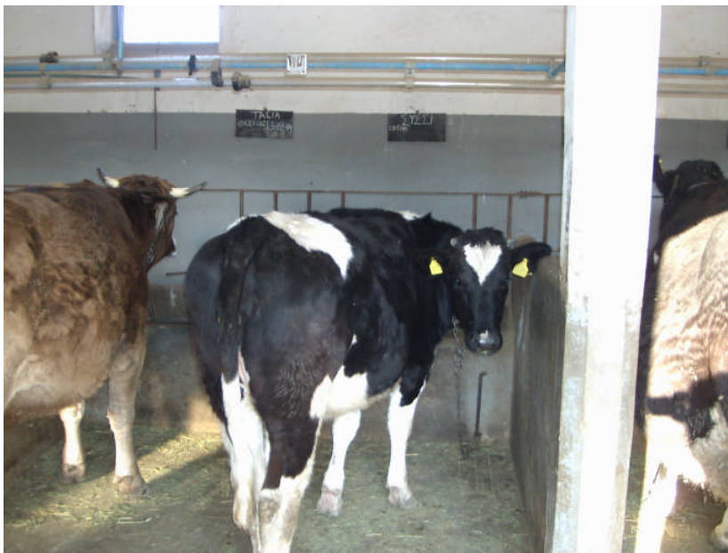
Εικ. 12: Εσωτερική άποψη μεγάλου στάβλου

(β) Χώρος συλλογής του γάλακτος . Υπάρχουν τα συστήματα των αμελκτικών μηχανών και τα ειδικά δοχεία συλλογής του γάλακτος για τη συντήρησή του (παγολεκάνες). Η μηχανική άμελξη, σε όλα τα ζώα, στηρίζεται σε μια διαφορά πίεσης που υπάρχει στο εσωτερικό του μαστού (θετική) και αυτήν που δημιουργούμε στον εξωτερικό χώρο της θηλής (αρνητική). Η υποπίεση αυτή (κενό) δημιουργείται με την αντλία κενού. Έτσι, υπάρχει ένα