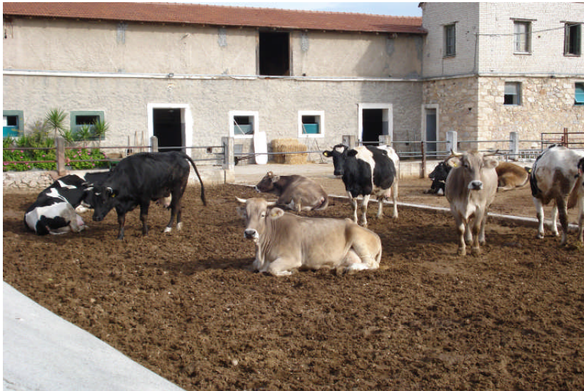
Εικ. 10: Εξωτερική άποψη μεγάλου στάβλου και προαύλιο

Επίσης, πάνω από το χώρο ενσταυλισμού των αγελάδων και σε ύψος 2μ. περίπου υπάρχει δίκτυο σωληνώσεων που χρησιμοποιούνται για τη μηχανική άμελη των ζώων δύο φορές ημερησίως.