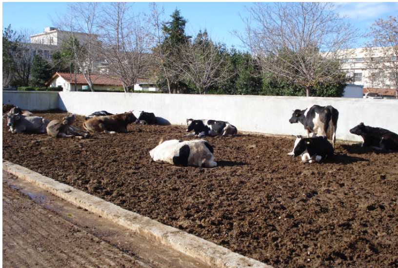
Εικ.5: Χωμάτινο τμήμα μεγάλου εξωτερικού προαυλίου

(β) Εξωτερικό στέγαστρο . Προορίζεται για ανάπαυση των αγελάδων τις περιόδους με άσχημες καιρικές συνθήκες (βροχή, υπερβολική ζέστη) (Εικ. 6 και 7).