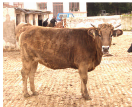
Εικ. 2: Φυλή Φαιά των Άλπεων