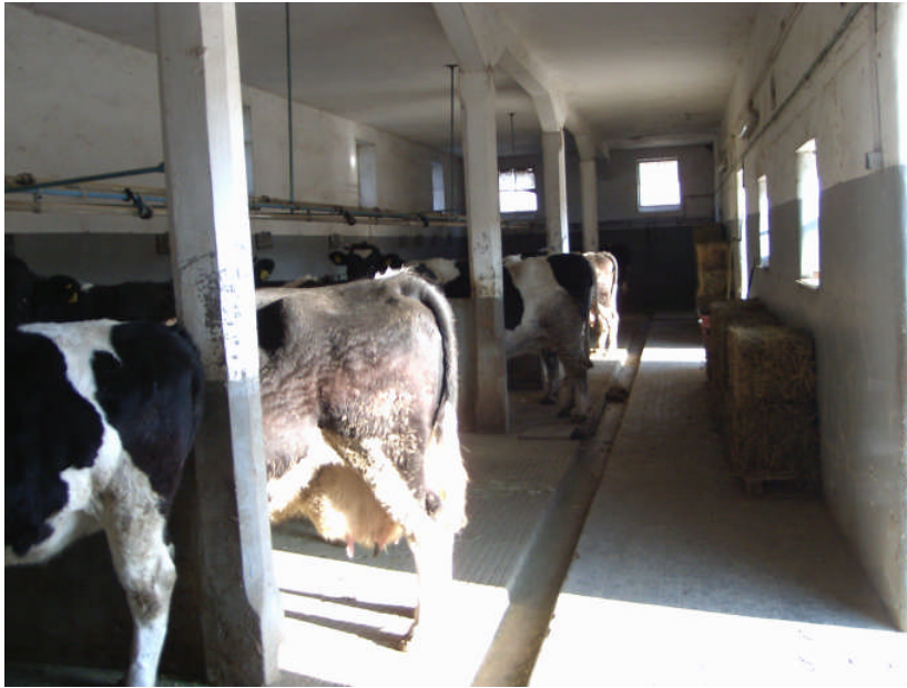
Εικ. 11: Εσωτερική άποψη μεγάλου στάβλου