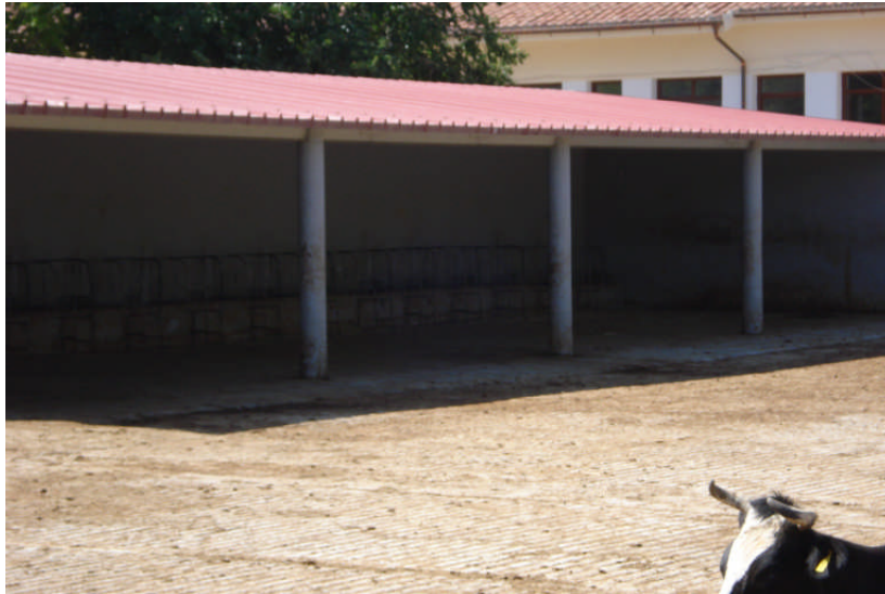
Εικ. 6: Εξωτερικό στέγαστρο