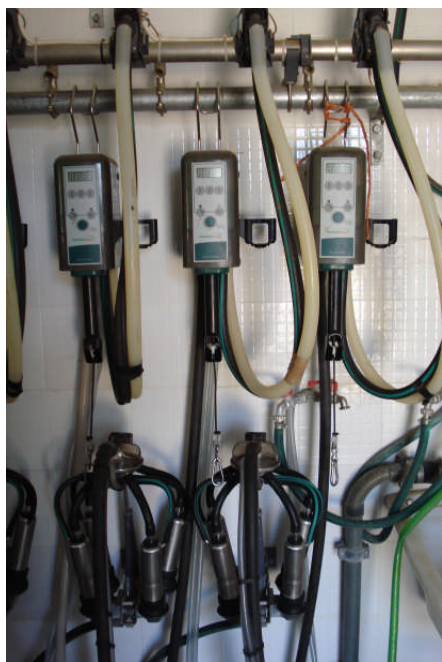
Εικ. 13: Αμελκτικές μηχανές

κλειστό σύστημα σωληνώσεων, όπου διακρίνονται δύο δίκτυα. Το δίκτυο του κενού αέρος (κίνηση μορίων αέρος) και το δίκτυο γάλακτος – καθαριστικού (κίνηση μορίων αέρος και υγρών), (Εικ. 13 και 14).