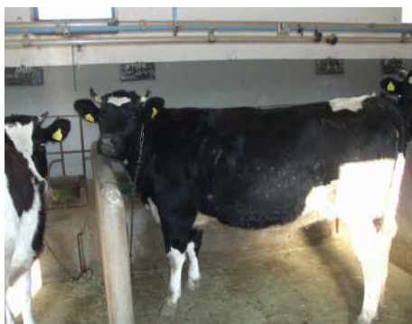
Εικ. 1: Φυλή Holstein-Friesian

Τα βοοειδή, ανάλογα με τη σωματική τους κατάσταση και την παραγωγική τους κατεύθυνση, κατατάσσονται σε τρεις τύπους: (α) το γαλακτοπαραγωγικό τύπο, (β) τον κρεοπαραγωγικό τύπο και (γ) το γαλακτοπαραγωγικό τύπο συνδυασμένων αποδόσεων, με ικανοποιητικές αποδόσεις και σε κρέας. Στο Γ.Π.Α. εκτρέφονται 2 φυλές βοοειδών: (α) η Holstein – Friesian ή Ολλανδική η οποία είναι γαλακτοπαραγωγός φυλή υψηλών αποδόσεων (20 – 40 kg γάλα ημερησίως), με συνήθη χρωματισμό άσπρο – μαύρο (Εικ. 1). (β) η Brown Swiss ή Schwyz ή Σβιτς ή Φαιά των Άλπεων η οποία ανήκει στις γαλακτοπαραγωγικές φυλές συνδυασμένων αποδόσεων με συνήθη χρωματισμό καφέ – μπεζ (Εικ. 2).