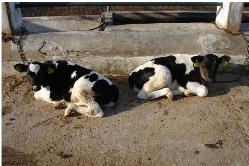
Εικ. 18: Μόσχοι δίδυμης κύησης ηλικίας 1 μηνός