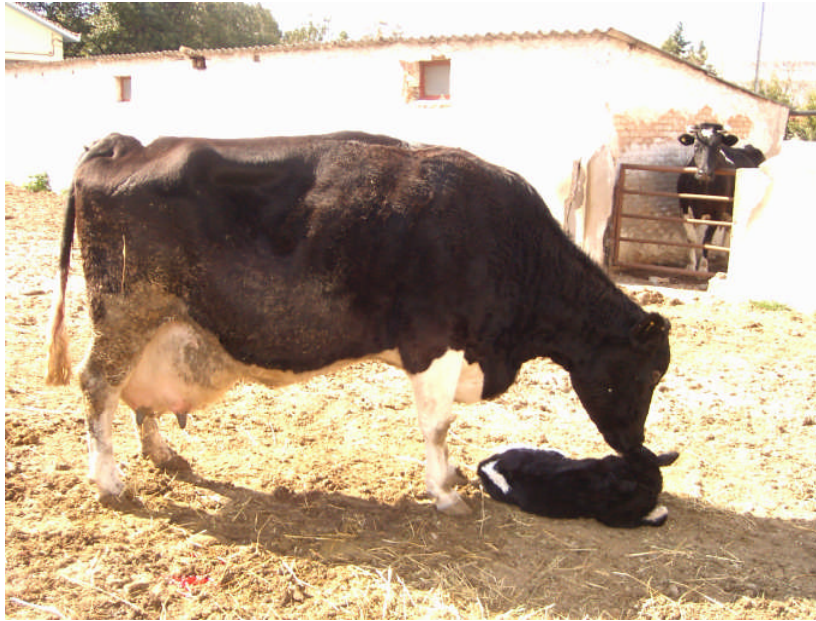
Εικ. 15: Μονόδυμος τοκετός