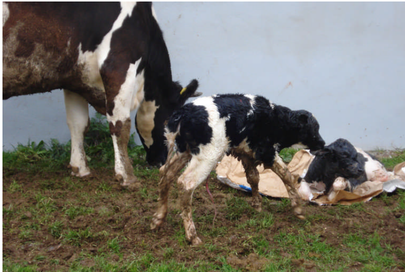
Εικ. 16: Δίδυμος τοκετός

(δ) Χώρος ανάπαυσης μόσχων – Διαχείριση μόσχων . Στους χώρους αυτούς μεταφέρονται οι μόσχοι αμέσως μετά τη γέννησή τους, όπου εφαρμόζεται τεχνητός θηλασμός, όπως εφαρμόζεται σε όλες τις εκτροφές γαλακτοπαραγωγών αγελάδων. Τα μοσχάρια δεν παραμένουν κοντά στις μητέρες τους για να θηλάσουν, αλλά απομακρύνονται αμέσως μετά τον τοκετό και αναπτύσσονται με πρωτόγαλα, τις 2-3 πρώτες ημέρες, και με πλήρες γάλα ή σκόνη γάλακτος αργότερα, μέχρι τον απογαλακτισμό τους, ο οποίος λαμβάνει χώρα στην ηλικία των 2 έως 3 μηνών. Θα πρέπει να σημειωθεί ότι το γάλα δίνεται στο μόσχο στην κατάλληλη θερμοκρασία των 37°C. Από 2