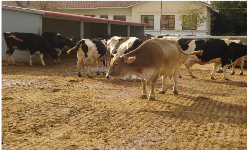
Εικ.4: Τσιμεντένιο τμήμα μεγάλου εξωτερικού προαυλίου