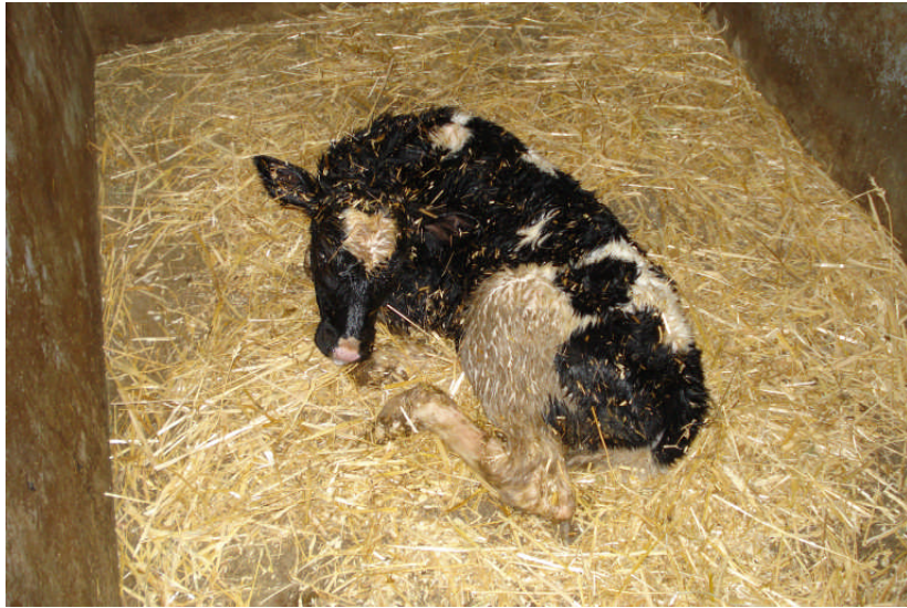
Εικ. 17: Νεογέννητος μόσχος

μηνών χορηγείται επιπροσθέτως στο μόσχο και ξηρά τροφή (χονδροειδείς και συμπυκνωμένες), ώστε να αναπτυχθούν σταδιακά οι προστόμαχοι και να μετατραπεί σε μηρυκαστικό. Οι θηλυκοί μόσχοι διατηρούνται στην αγέλη του Γ.Π.Α. σαν ζώα αντικατάστασης, ενώ οι αρσενικοί μόσχοι, ηλικίας 1-3 μηνών, πωλούνται σαν ζώα αναπαραγωγής σε κτηνοτρόφους ανά την Ελλάδα και εφόσον πληρούν τις προϋποθέσεις της Νομοθεσίας (Εικ. 17, 18 και 19).