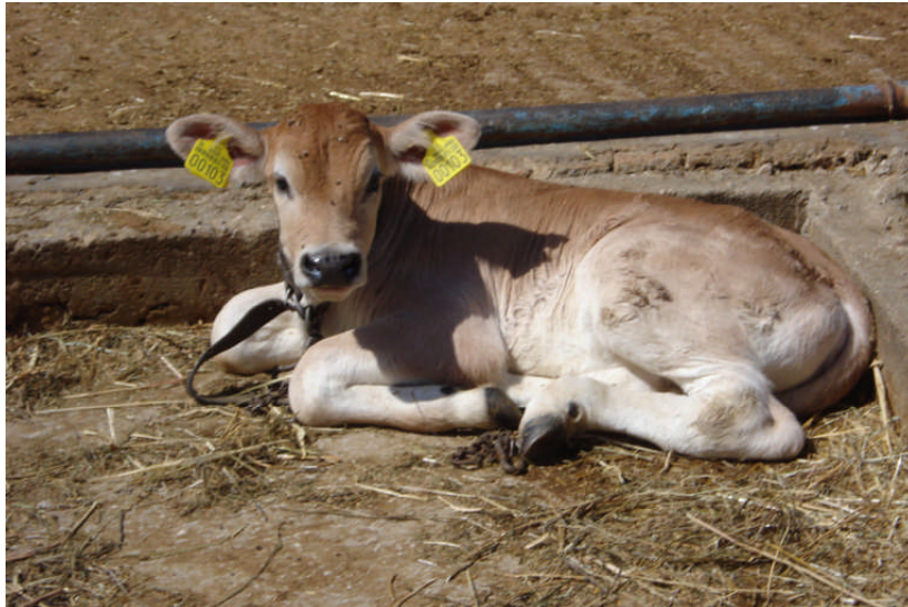
Εικ. 19: Μόσχος ηλικίας 2 μηνών