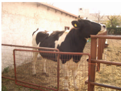
Εικ. 8: Μικρό προαύλιο

(γ) Μικρό προαύλιο . Βρίσκεται πίσω από το εξωτερικό στέγαστρο και χρησιμεύει ως χώρος ανάπαυσης των μοσχίδων (Εικ. 8 και 9).