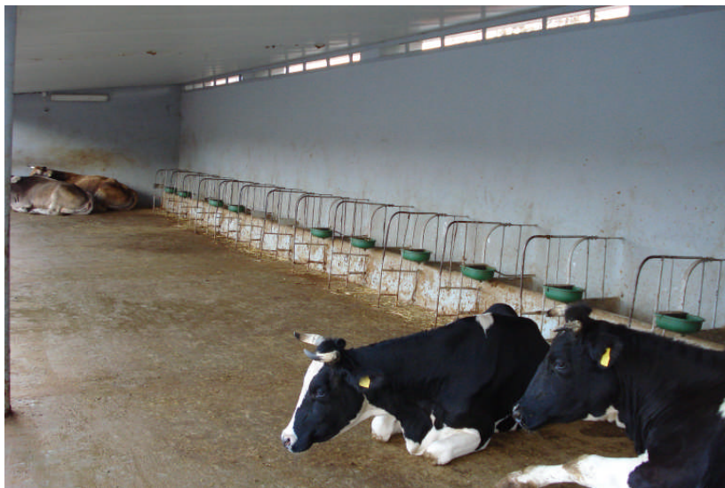
Εικ. 7: Εσωτερική άποψη του στεγάστρου

(γ) Μικρό προαύλιο . Βρίσκεται πίσω από το εξωτερικό στέγαστρο και χρησιμεύει ως χώρος ανάπαυσης των μοσχίδων (Εικ. 8 και 9).