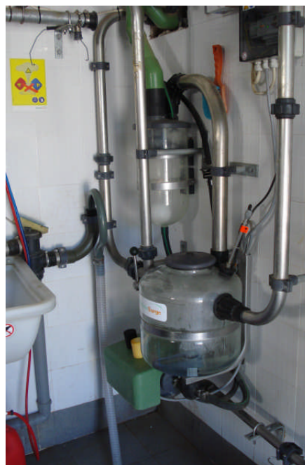
Εικ. 14: Αμελκτικές μηχανές

(γ) Χώρος τοκετού . Στο χώρο αυτό μεταφέρεται η επίτοκος αγελάδα, όταν είναι έτοιμη να γεννήσει, δηλαδή όταν εμφανιστούν συμπτώματα τοκετού όπως, πρησμένος μαστός, υπεραιμικά και εξοιδημένα εξωτερικά γεννητικά όργανα με έκκριση βλέννας. Κατά την παραμονή της στο χώρο αυτό, υπάρχει επικοινωνία του σταυλίτη με το νυχτερινό φύλακα του Πανεπιστημίου, ο οποίος περνά το βράδυ κατά τακτά χρονικά διαστήματα για να ειδοποιήσει όταν η αγελάδα πρόκειται να γεννήσει (Εικ. 15 και 16).