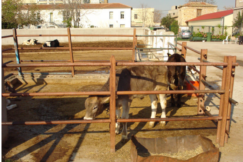
Εικ. 9: Μικρό προαύλιο

(δ) Μεγάλη τσιμεντένια ποτίστρα . Είναι γεμάτη με νερό όλες τις ώρες της ημέρας. Τους θερινούς μήνες που οι ανάγκες σε νερό είναι μεγαλύτερες υπάρχει ατομική, αυτόματη ποτίστρα και μέσα στο σταύλο, για να έχουν άφθονο νερό στη διάθεσή τους.