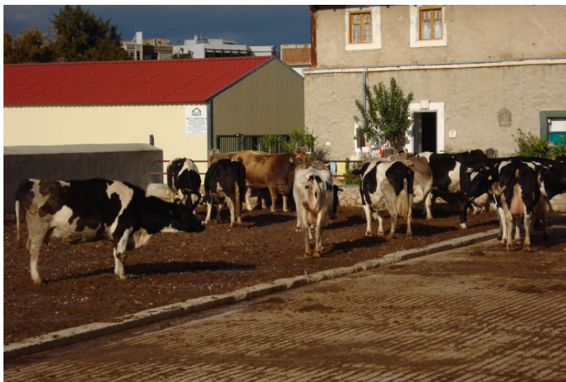
Εικ.3: Μεγάλο εξωτερικό προαύλιο

Κατά τις ημέρες των βροχοπτώσεων τοποθετούνται στύλοι, στο τσιμεντένιο «πεζούλι», σε απόσταση 1μ. μεταξύ τους, απ' όπου περνά ηλεκτροφόρο καλώδιο τάσεως 9,5 V. Έτσι, οι αγελάδες ακουμπώντας το, απλά ενοχλούνται και κατευθύνονται στο τσιμεντένιο δάπεδο, παραμένουν εκεί μέχρι να στεγνώσει το χωμάτινο δάπεδο, οπότε επανέρχονται πάλι σ' αυτό (Εικ.3, 4 και 5).