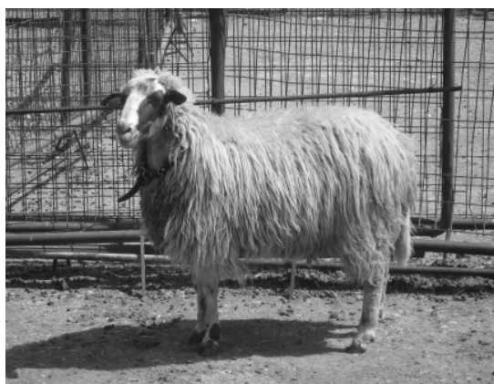
Εικόνα 3. Προβατίνα της Ορεινής φυλής Ηπείρου (Μπούτσικη)

Η Ορεινή φυλή Ηπείρου (εικόνα 3) εκτρέφεται σε ημιορεινές και ορεινές περιοχές του νομού Ιωαννίνων καθώς και στη Θεσσαλία. Ο πληθυσμός της υπολογίζεται σε περίπου 2500 άτομα.