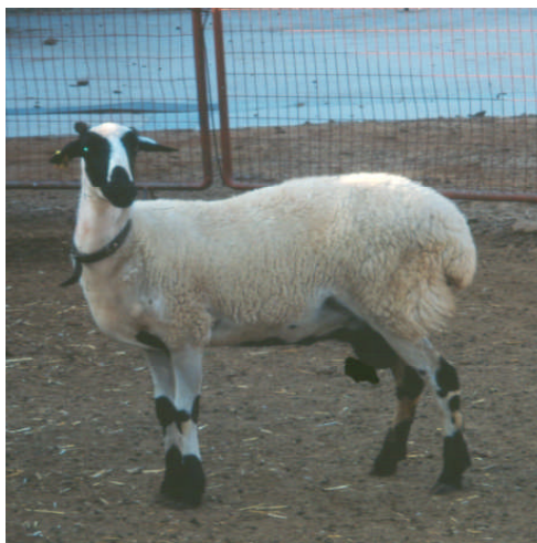
Εικόνα 2. Προβατίνα της φυλής Χίου

Το Χιώτικο πρόβατο είναι από τα πιο μεγαλόσωμα ελληνικά πρόβατα. Το μέσο ύψος ακρωμίου ανέρχεται στα 84 cm για τους κριούς και στα 76 cm για τις προβατίνες με μέσα σωματικά βάρη 87 και 66 kg, αντίστοιχα. Ο χρωματισμός είναι λευκός με μαύρες διακριτές κηλίδες στο πρόσωπο, κυρίως γύρω από τα μάτια, το στόμα, τα αυτιά, τα άκρα και ενίοτε την κοιλιακή χώρα. Ο τύπος του ερίου είναι ομοιόμαλλος, αν και σε πολλά άτομα διακρίνονται αγανώδεις τρίχες ανάμεσα στις εριότριχες. Τα αρσενικά φέρουν πάντοτε κέρατα, ενώ τα θηλυκά συνήθως φέρουν μικρά ψευδοκέρατα.