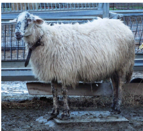
Εικόνα 1. Καραγκούνικο πρόβατο

Ως προς τον τύπο του ερίου το Καραγκούνικο κατατάσσεται στα αναμικτόμαλλα πρόβατα. Τα αναμικτόμαλλα πρόβατα έχουν αρκετές αγανώδεις τρίχες (μακριές και χονδρές) και ελάχιστες εριότριχες (βραχείες). Ο λαιμός είναι γυμνός από μαλλί (έριο) και φέρει καλυπτήριες τρίχες. Είναι χαρακτηριστικό το κυρτό επιρρίνιο. Τα αρσενικά άτομα μπορεί να φέρουν κέρατα, τα θηλυκά όμως είναι ακέρατα. Η ουρά είναι μέσου μήκους και σχετικά λεπτή.